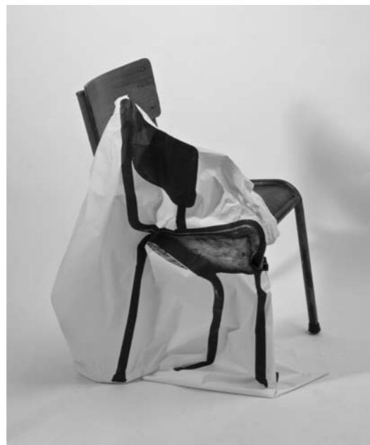
Chaise II , épreuve jet d'encre 1/1, chaise, tirage argentique, 2011