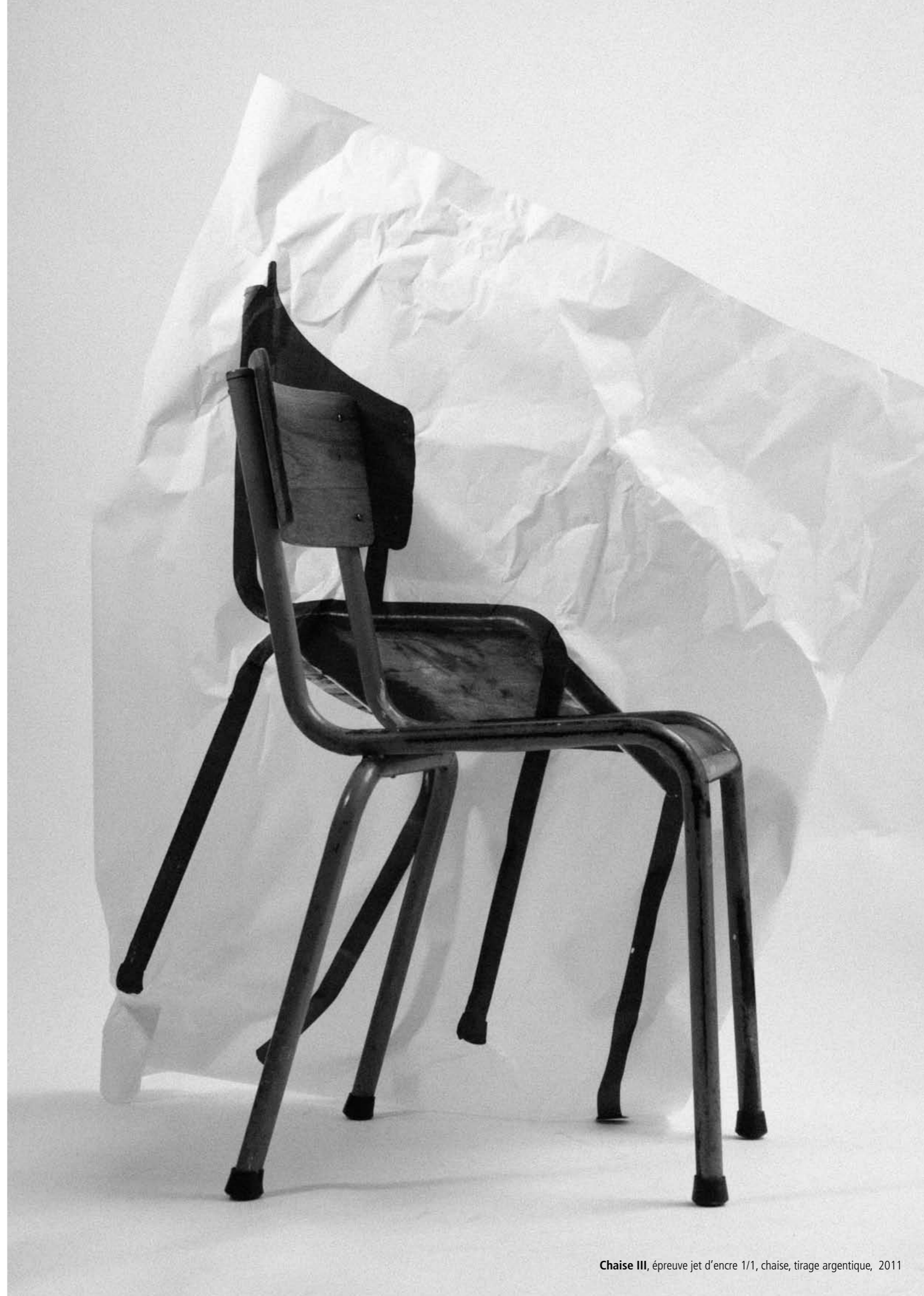
Chaise III , épreuve jet d'encre 1/1, chaise, tirage argentique, 2011