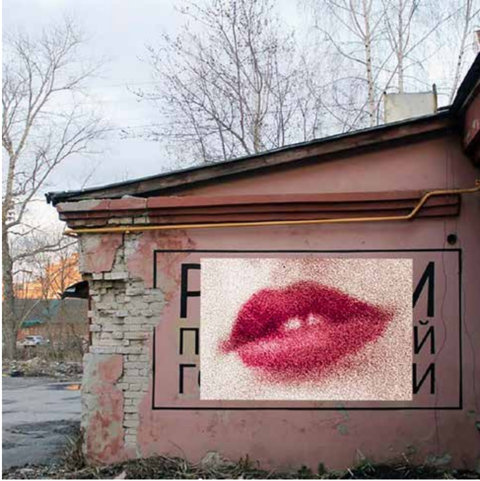
STREET ART MOSCOW RUSSIA