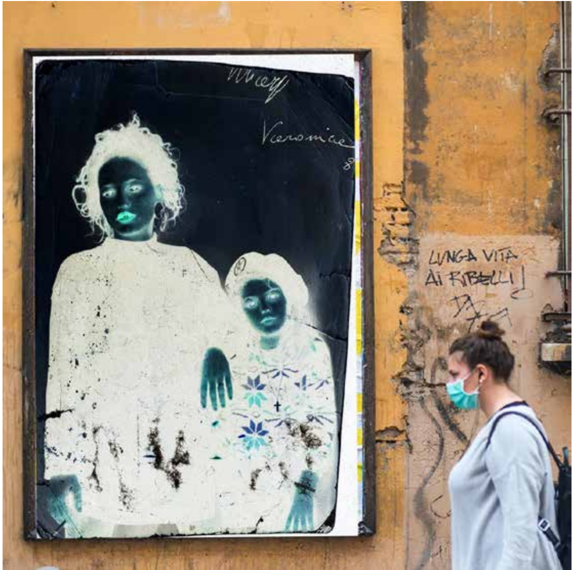
STREET ART BOLOGNA ITALY