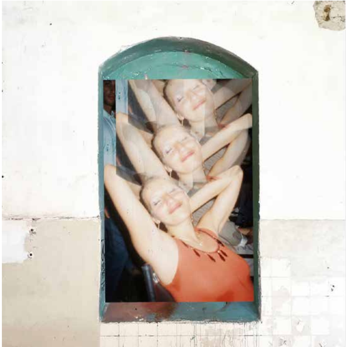
STREET ART NAPOLI ITALY