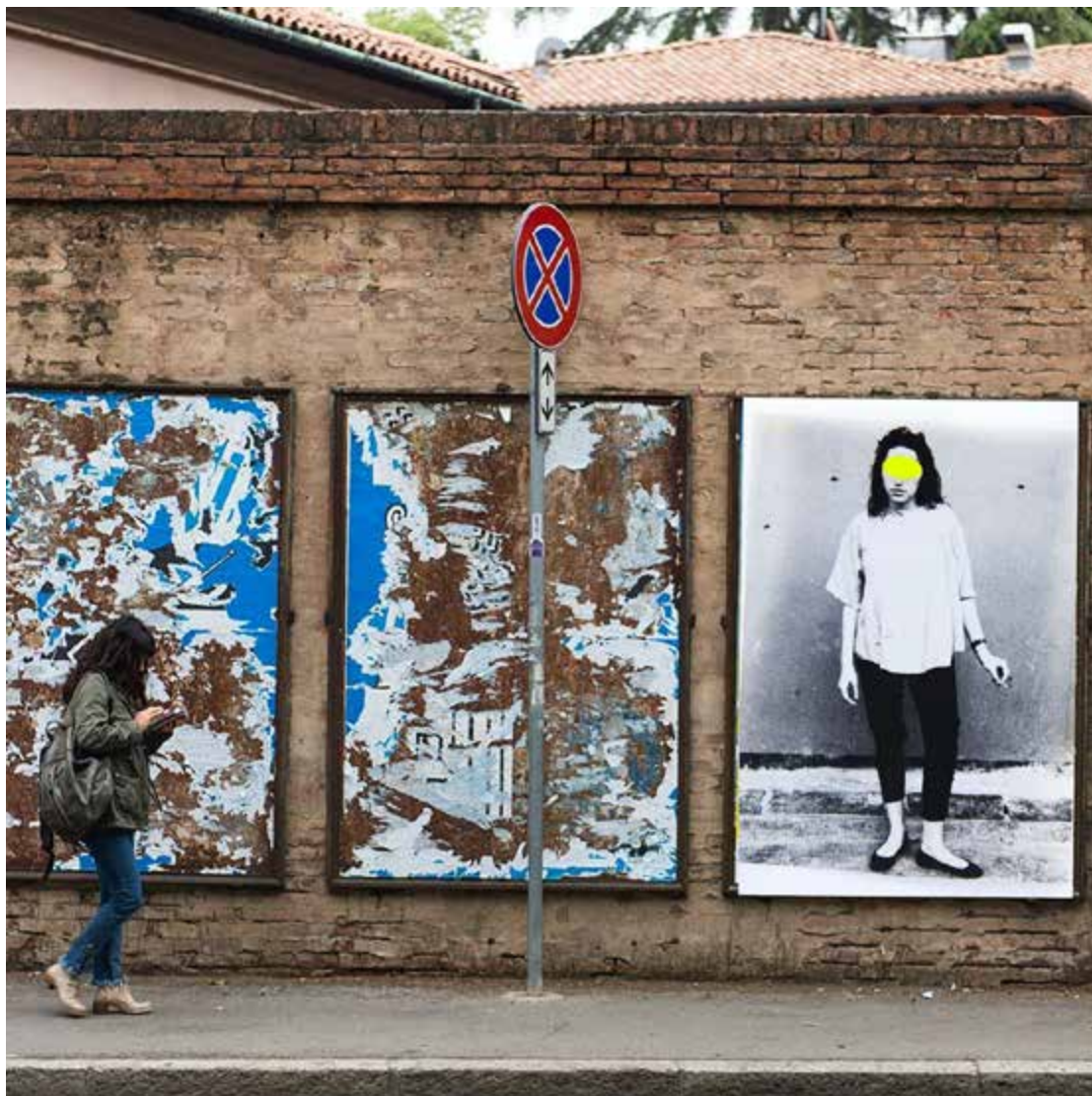
STREET ART BOLOGNA ITALY